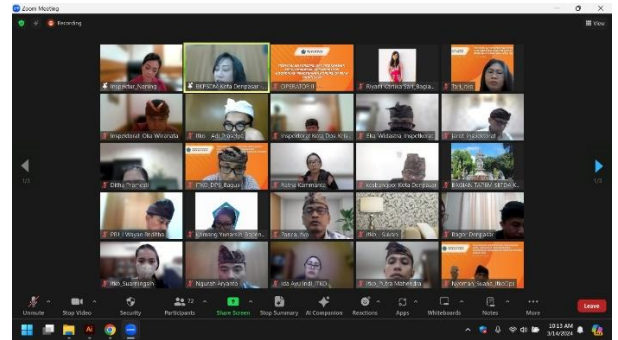
BPK Exit Meeting