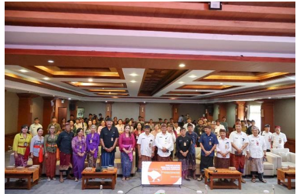
Forum Perangkat Daerah Inspektorat Kota Denpasar