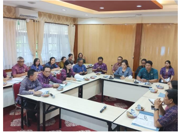
Rapat Koordinasi Pengawasan Tahun 2024