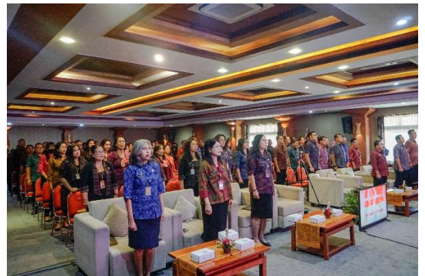
Rapat Penyamaan Persepsi Terhadap Pelaksanaan Pelaksanaan Pengadaan Barang/Jasa Konstruksi melalui e-Purchasing