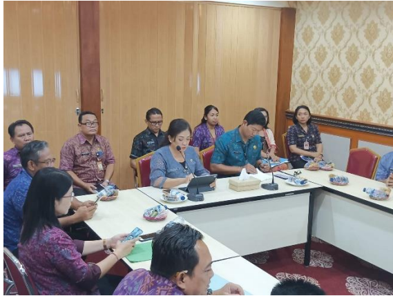
Pembahasan Naskah Hasil Pemeriksaan Inspektorat Provinsi Bali pada Pemerintah Kota Denpasar