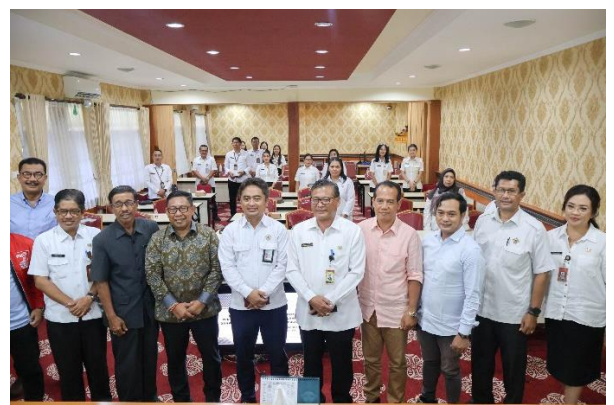
Menerima Tim SPIP BPKP