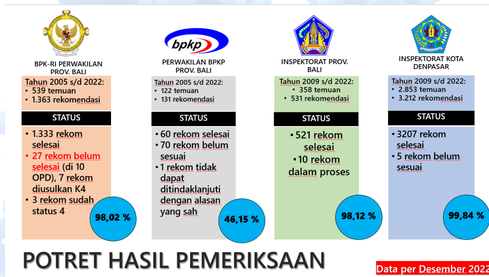
Gambar 2.5 Potret Hasil Tindak Lanjut Hasil Temuan Tahun 2022

Untuk mencapai sasaran meningkatkan efektifitas pemantauan pelaksanaan tindak lanjut hasil pengawasan Inspektorat Kota Denpasar menargetkan Prosentase rekomendasi hasil pemeriksaan oleh APIP dan BPK yang dapat ditindaklanjuti secara tuntas sebesar 90%. Untuk tahun anggaran 2022 jumlah temuan tindak lanjut hasil pemeriksaan yang ditindaklanjuti oleh OPD yang menjadi Obyek Pemeriksaan dengan prosentase capaiannya sebesar 85.53% dari yang ditargetkan sebesar 90% (detail pada gambar 6). Hal ini terjadi karena penyelesaian tindak lanjut temuan belum sepenuhnya dapat dilaksanakan oleh obrik, kesulitan dalam melengkapi data pendukung, mengalami keterlambatan dan sering tidak tepat waktu.