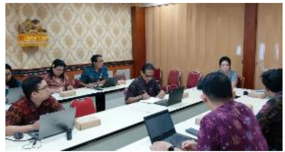
Rapat Paripurna ke-7 Masa Persidangan II tahun 2024