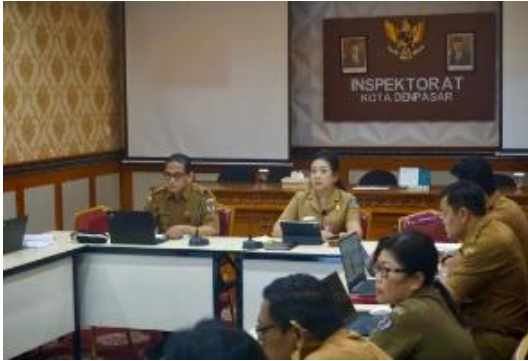
Rapat Internal terkait Pemenuhan Data Dukung MCP Tahun 2024