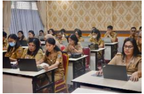
Rapat Tindak Lanjut Pembahasan dan Sinkronisasi Perwali Pengelolaan Pengaduan