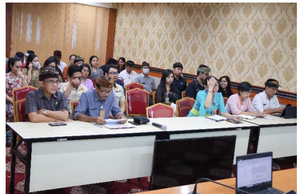
Kordinasi Pengawasan Netralisir ASN