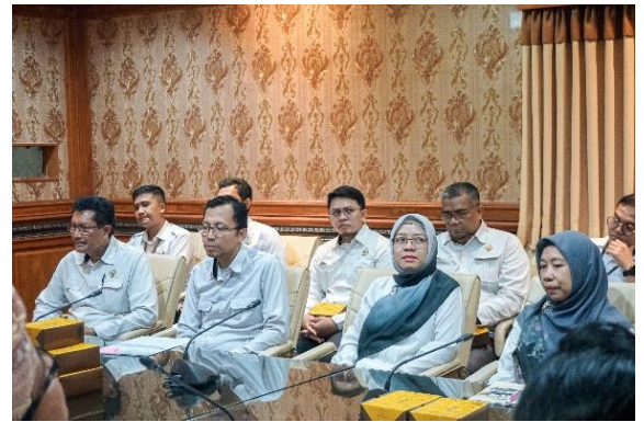
Menerima Kunjungan dari Inspektorat Daerah Kabupaten Musi Rawas