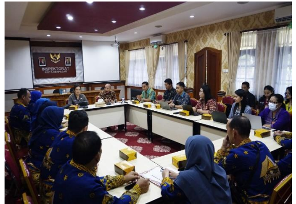
Penandatanganan Pakta Integritas dan Komitmen Antikorupsi Pemerintah Kota Denpasar