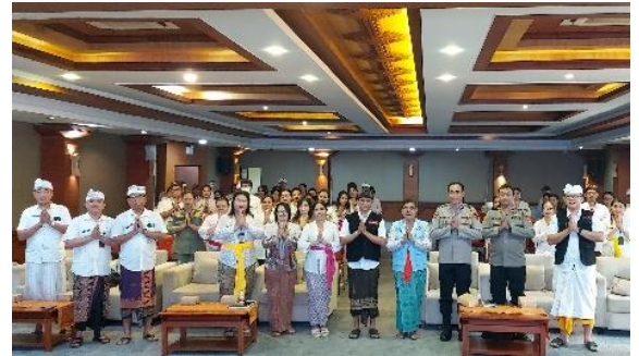
Penyerahan LHP BPK RI