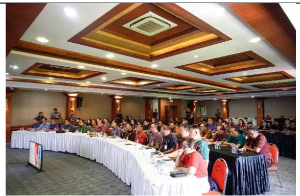
Exit Meeting Tim BPK Perwakilan Provinsi Bali