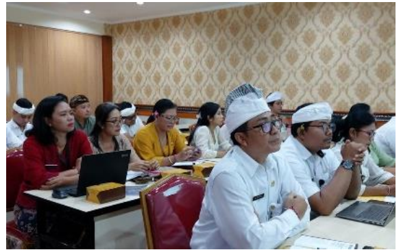
Rapat Pembahasan Draft Perubahan Regulasi Pengelolaan Pengaduan