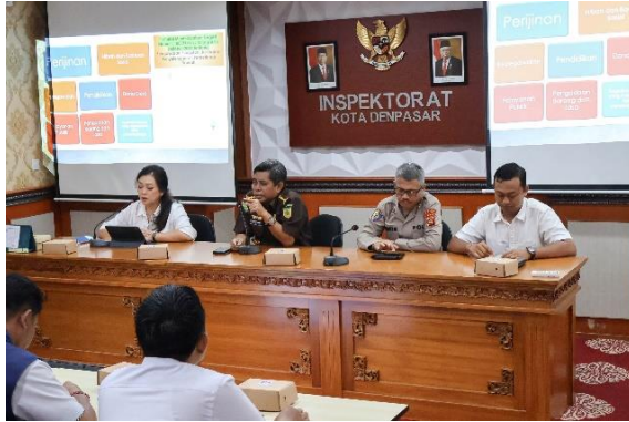
Monitoring dan Konsolidasi ke UPP Kabupaten/Kota se Bali