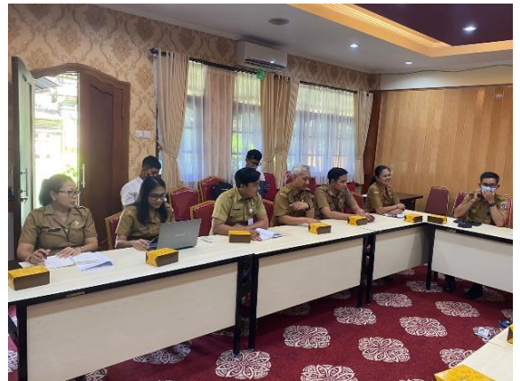
Penyampaian Konsep Laporan Hasil Pemeriksaan dan Tanggapan serta Rencana Aksi atas Pemeriksaan LKPD Tahun 2023