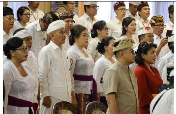
Forum Group Discussion (FGD) IPKD, IID, dan IKKD