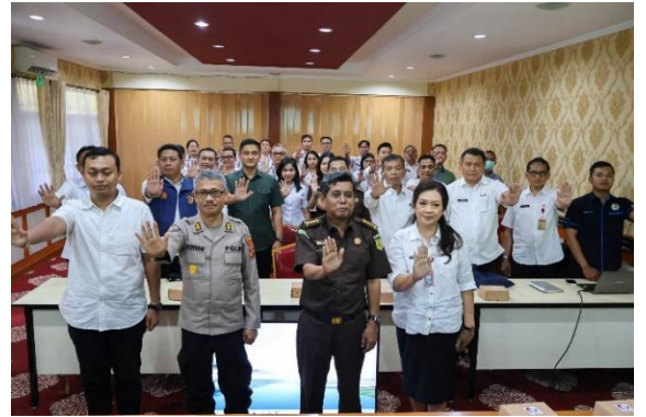
Dialog Pemenuhan Data Evaluasi SAKIP